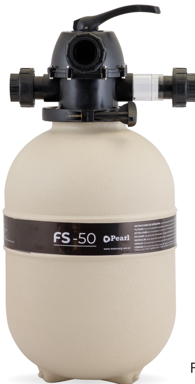
FS FILTROS PARA PISCINA